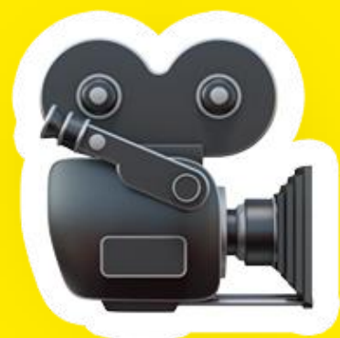
Métiers de la production vidéo