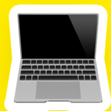
Production de sites